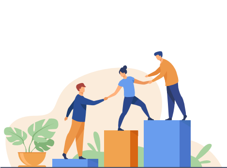
კლიარება და აქცეპტირება

ID37 -სა და სურს ტესტების შედეგებზე დაყრდნობით, ID37 მასტერისა და მენტალ ჰაბის ფსიქოლოგთა გუნდის მიერ დაიგეგმება და განხორციელდება თიმბილდინგი: