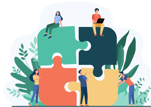
ინდივიდუალური და გუნდური „სუზრების“ იდენტიფიცირება