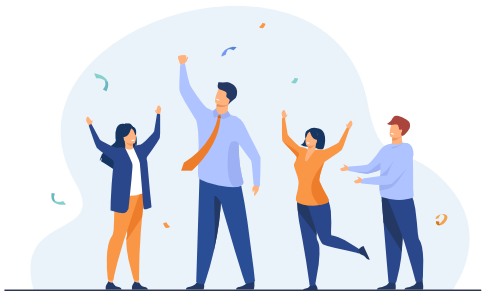
ჯანსაღი კორპორაციული კულტურის ძირითადი პრინციპების შემუშავება